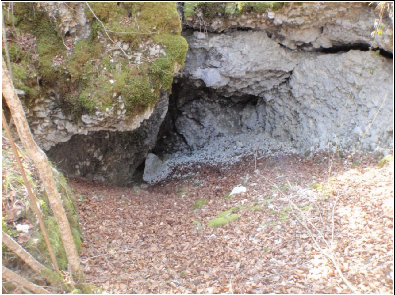
Eingangsdoline: Einstieg in Bildmitte

steil aufsteigen. Oben im flacher werdenden Bereich befindet sich linkerhand zwischen den Bäumen die Doline, ein bis zwei Minuten Fußweg von der Glacière du Bois du Roi entfernt.